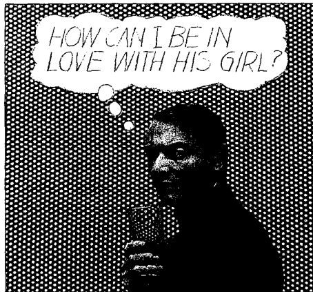
Un ritratto di Roy Lichtenstein scattato da Ugo Mulas a New York nel 1964 (dal catalogo Electa della mostra alla Gam di Torino «Ugo Mulas. La scena dell'arte. Photocolors», fino al 5 ottobre)

dependono da eventi successivi che non possono essere previsti, non essendoci leggi che consentano di farlo, e queste descrizioni non possono essere comprese, poiché implicano conseguenze che non possono essere immaginate. Nel mio libro Analytical Philosophy of History (Filosofia analitica della storia) , del 1965, poi ripubblicato nel 1985 con il titolo Narration and Knowledge (Narrazione e conoscenza) , ho utilizzato come paradigma la celebre poesia di Yeats, Leda e il cigno , che recita: « Quel rapido fremuto ai lombi causa le mura spezzate, il tetto e la torre incendiati e Agamennone morto ». Tutto ciò che fu generato dallo stupro di Leda era invisibile a chi avesse assistito alla violenza subita da una donna da parte di un cigno. Gli altri stupri commessi da Zeus, quello di Troia soltanto in seguito a una riedizione narrativa, la quale sarebbe stata coinvolta in uno dei più grandi eventi dell'antichità, la Guerra di Troia. Non c'era, né avrebbe potuto esserci, alcuna legge di natura in grado di mettere in rapporto il fre-