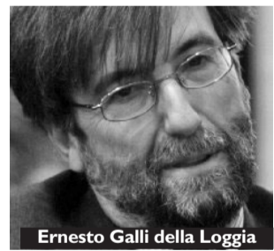
Ernesto Galli della Loggia

«Mi colpisce l'impatto che hanno avuto le due polarità della fede cristiana: la fede nell'incarnazione di Dio e nel compimento escatologico, nella fine dei tempi».