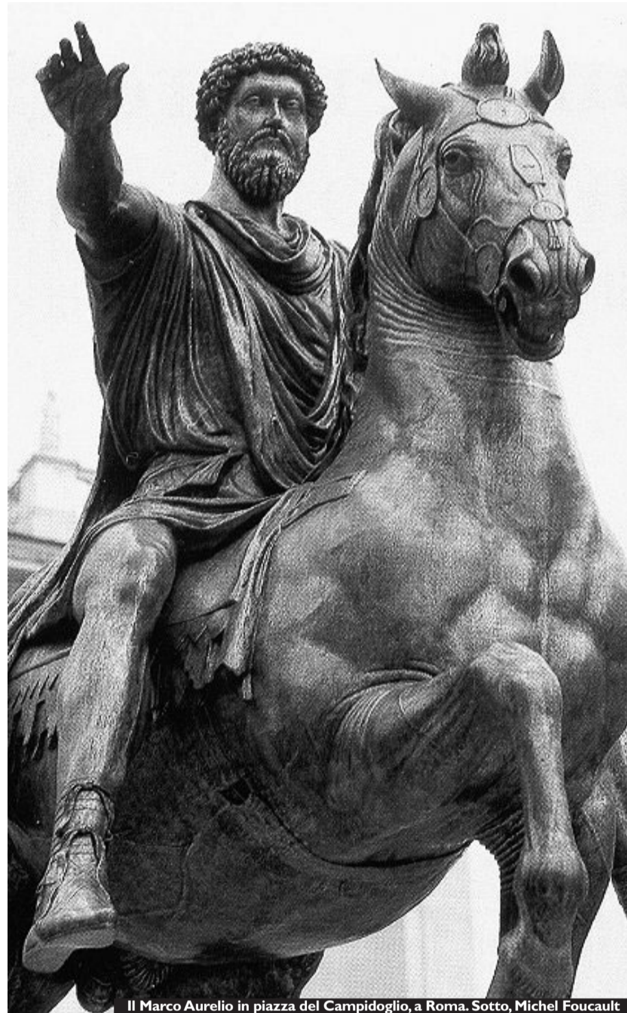
Il Marco Aurelio in piazza del Campidoglio, a Roma. Sotto, Michel Foucault

dell'autopossesso". Secondo l'autorevole mensile gesuita Etudes , che ha dedicato anch'essa un approfondimento al "gusto per gli stoici" e al dilagare della moda neo-stoicista, il rischio implicito della vulgata diffusa da Foucault è quello di «incoraggiare l'uomo ad abbandonare il mondo alla sua violenza e al suo caos».