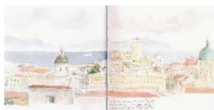
Uno dei taccuini che saranno in mostra alla Casa del Palladio

Lo scrittore algerino Tahar Lamri tra ruvido dialetto padano e cantastorie nordafricani