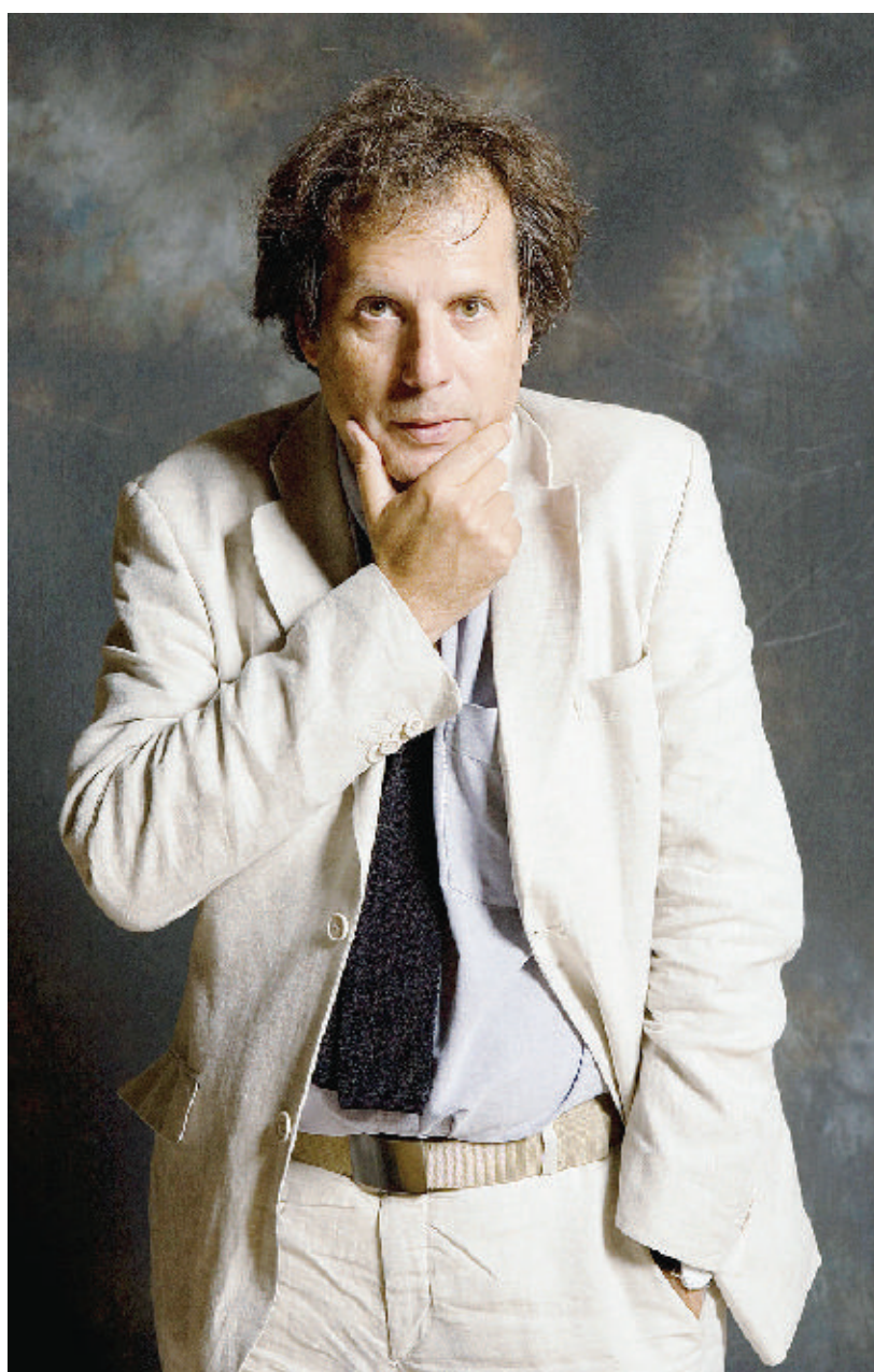
Maurizio Ferraris, docente di Filosofia teoretica all'Università di Torino